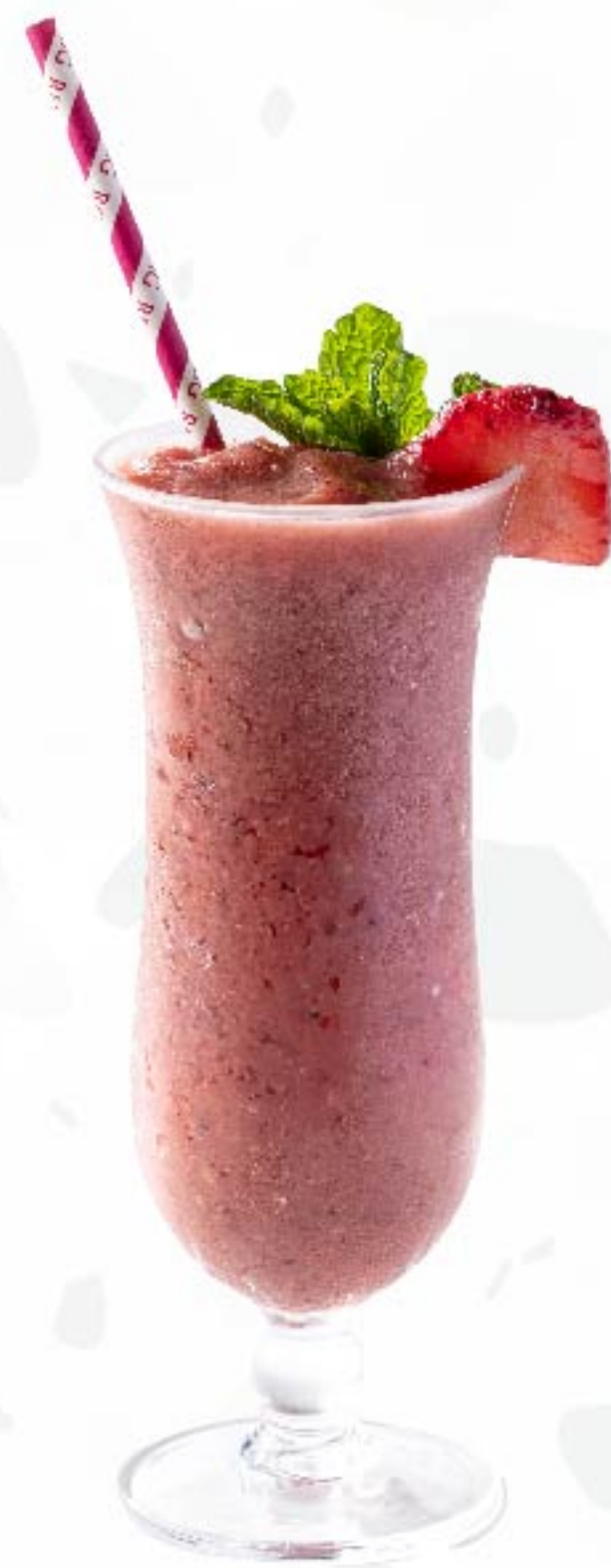
夢幻草莓 Strawberry Fantasy 草莓, 香蕉 Strawberry, Banana