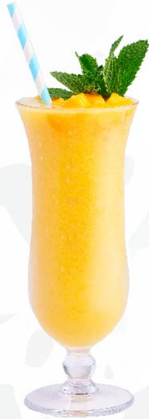
芒果之夢 Mango Dream 芒果, 雪梨 Mango, Pear