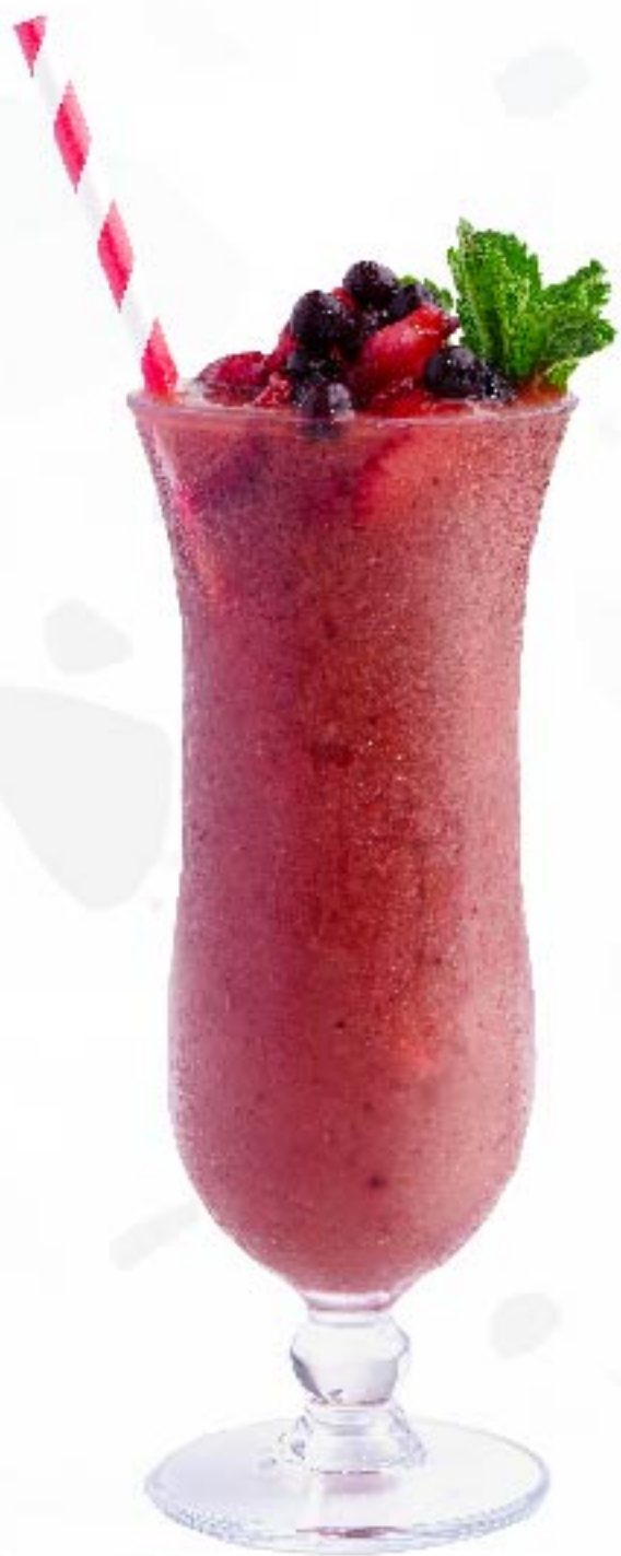
活力巴西莓 Acai Kick 草莓, 芒果, 藍莓, 巴西莓 Strawberry, Mango, Blueberry, Acai