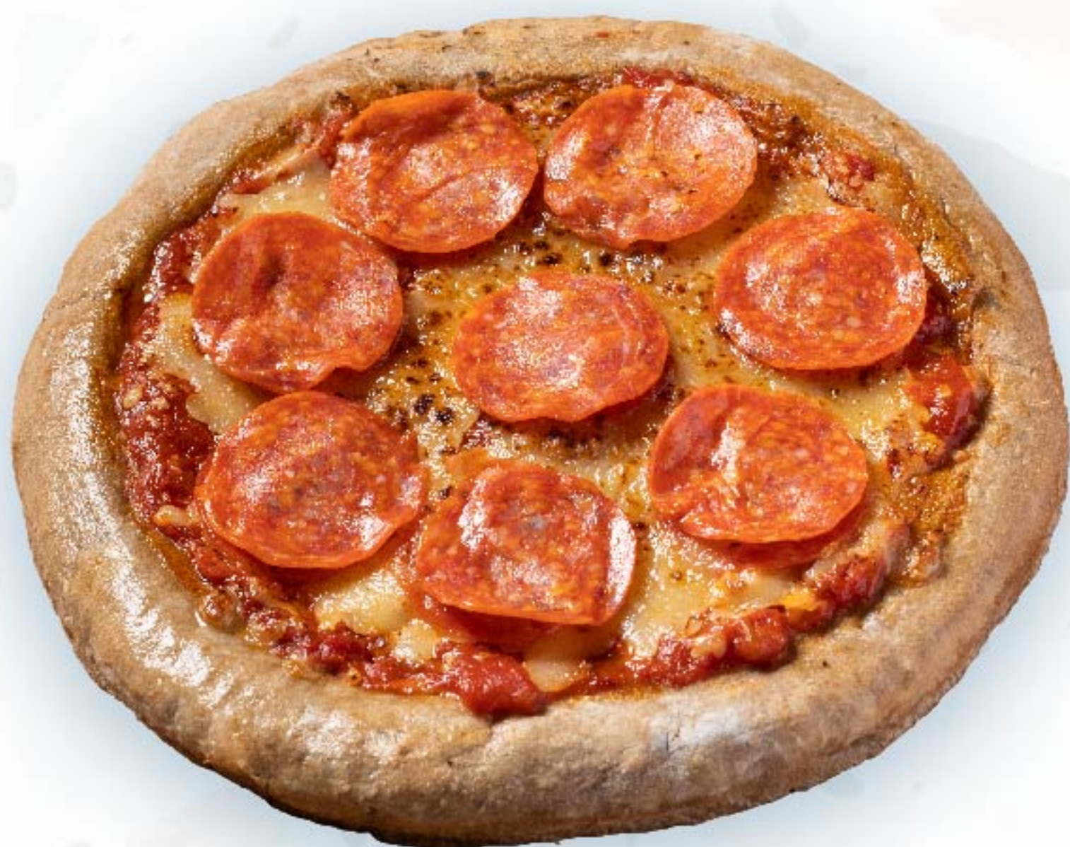
意大利辣肉肠披萨 Pepperoni Pizza