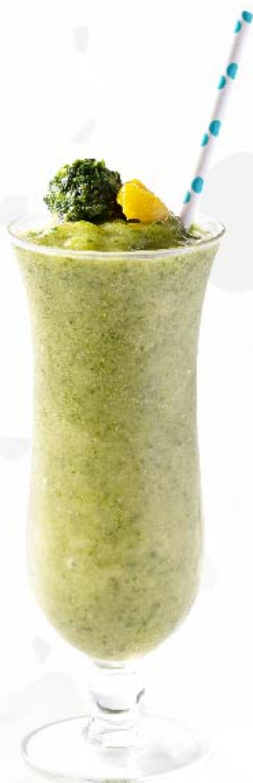
醒神青汁 Green Reviver 香蕉, 羽衣甘蓝, 芒果, 香茅 Banana, Kale, Mango, Lemongrass