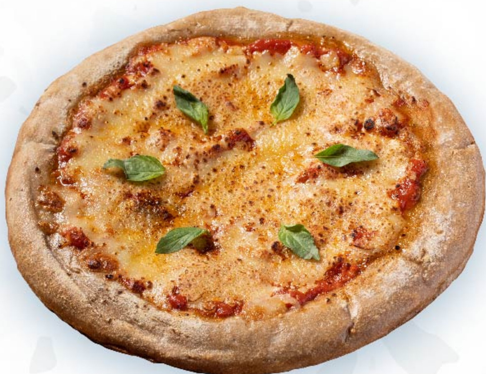
西红柿起司披萨 Margherita Pizza