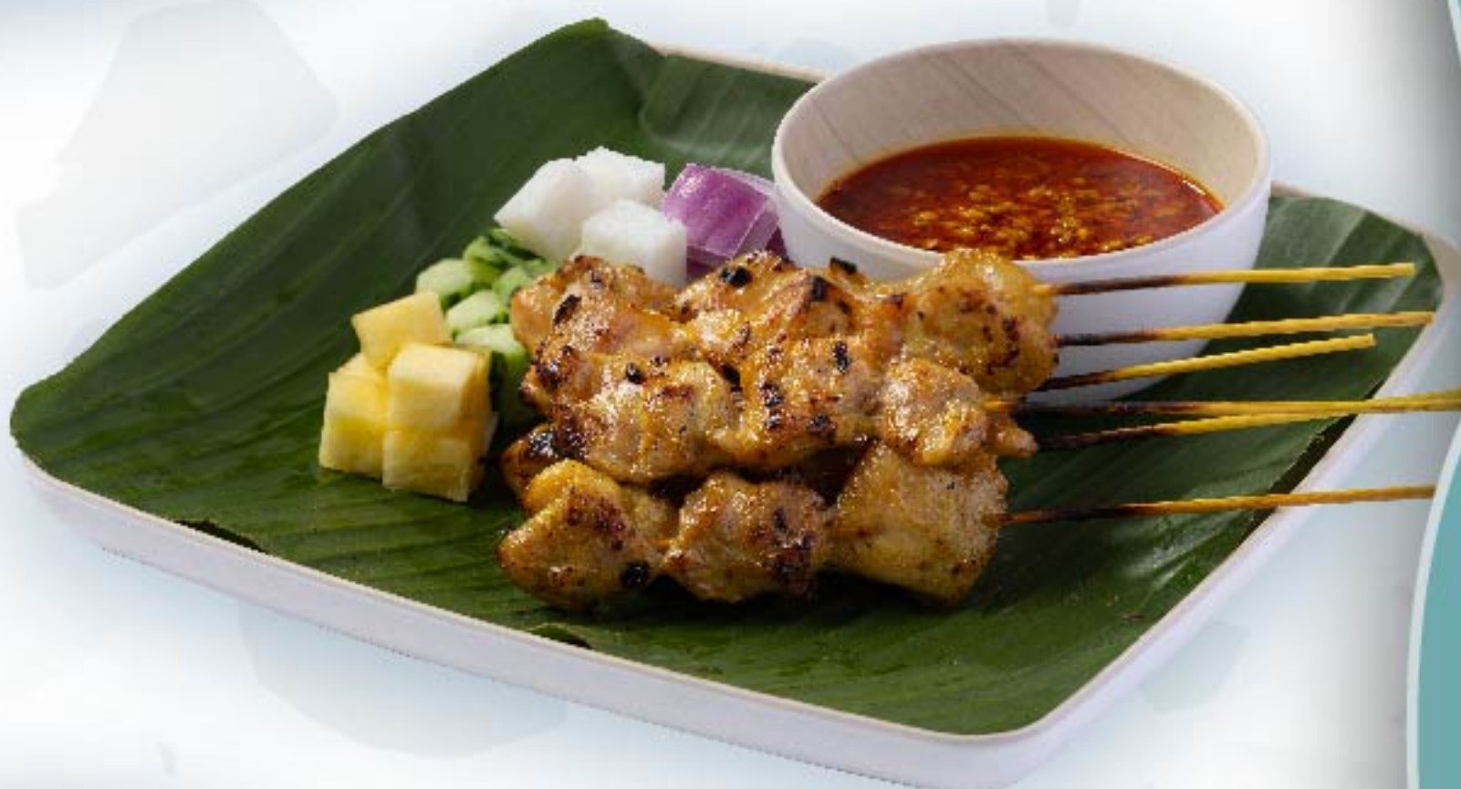
牛肉沙爹 Beef Satay