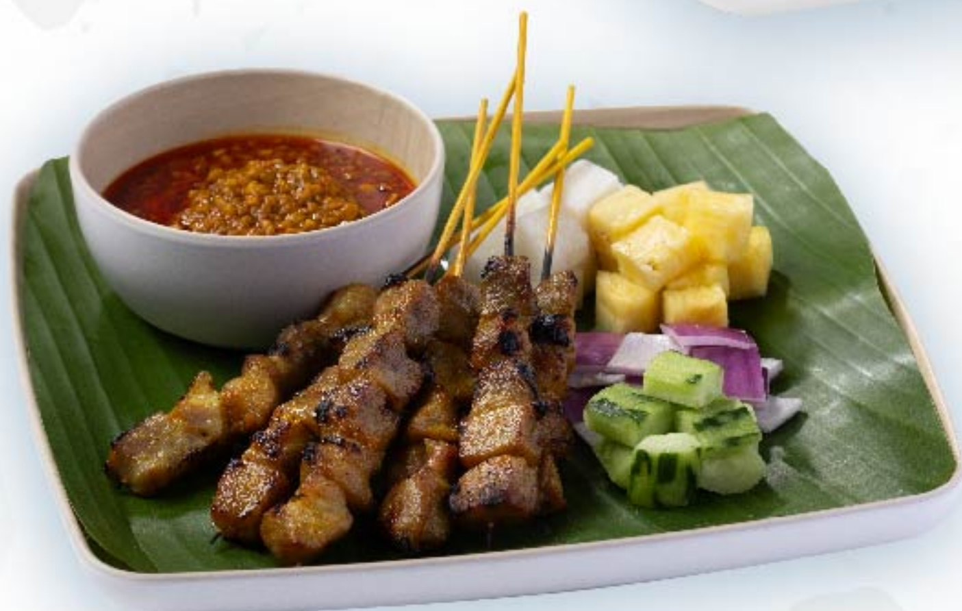
鸡肉沙爹 Chicken Satay